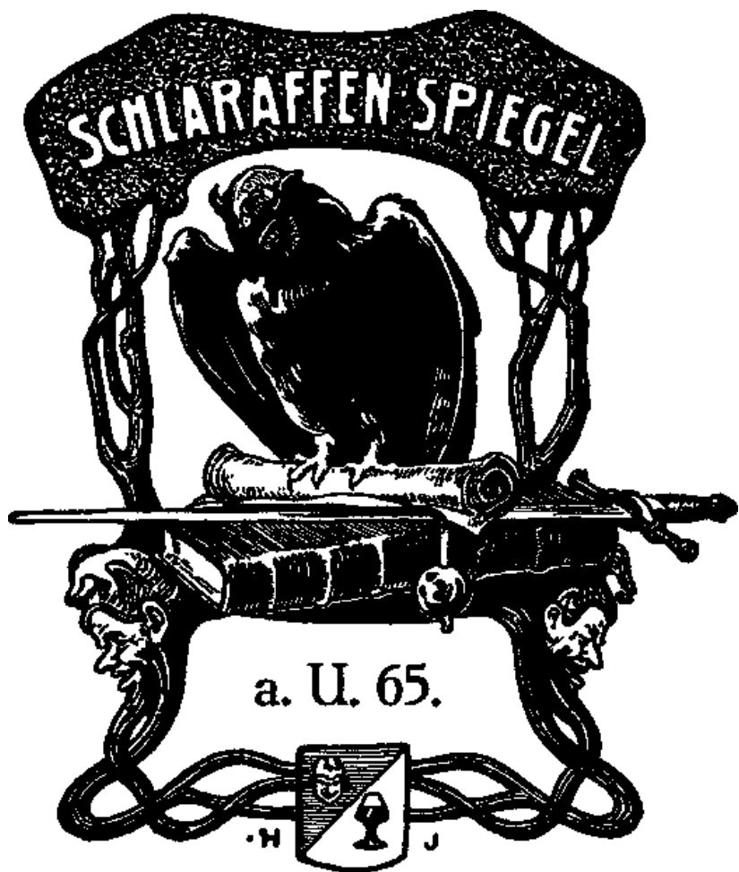
Historisches Titelbild des Schlaraffen-Spiegels a.U. 65